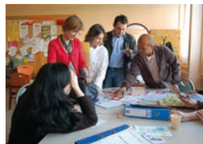
Résidence « Le Campus ouvert », Région Champagne-Ardenne.