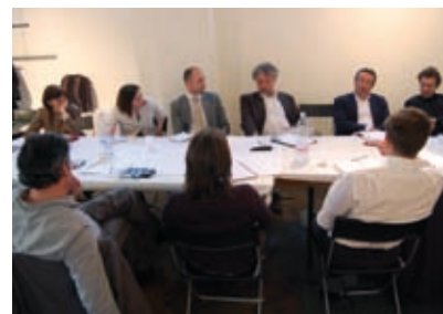
Prospective au Comité d'orientation de la 27 e Région.