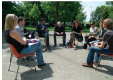
Résidence « La ville plateforme d'innovation ouverte », Région Aquitaine.