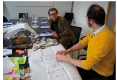
Résidence « L'environnement de travail de l' élu », Région Nord-Pas de Calais.