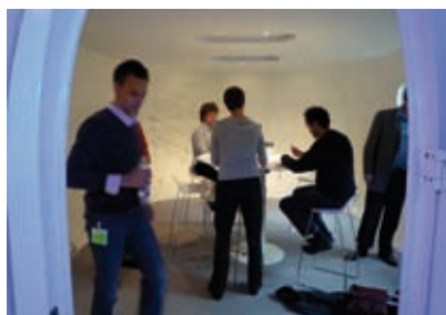
Workshop « prospective des labs », au MindLab à Copenhague.

« Interterritorial » : participation à un groupe de prospective animée par la Région Nord-Pas de Calais et l'agence Acadie.