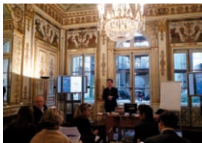
Intervention au club des directeurs de l'innovation.

Également: participation au jurys de l'ENSCI et de Strate College.