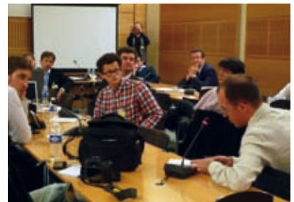
Projection du documentaire UsNow à l'Assemblée nationale.