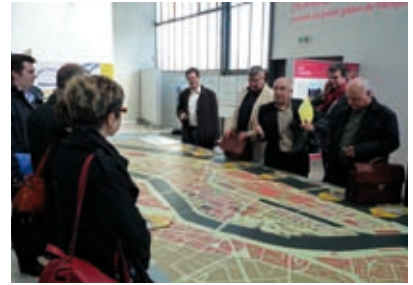
Prospective « Interterritorialité » avec la Région Nord-Pas de Calais