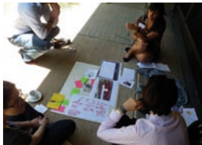
Université du Social Innovation Exchange, Lisbonne.