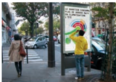
Résidence « La Région Basse-Consommation », Région Paca.