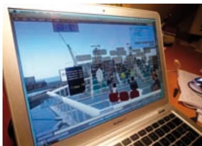
Intervention sur Second Life pour le sommet de l'OCDE à Pusan.