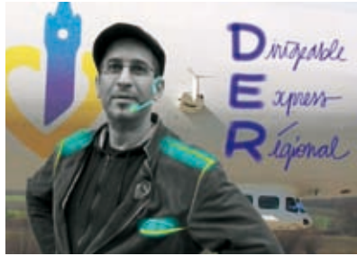
Production des 6 scénarios « Ma vie de ch'ti en 2028 », Région Nord-Pas de Calais