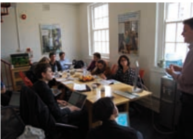
Voyage d'étude à Londres.

Documentaire en préparation pour fin 2010, sur les résidences.