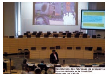
Test de micro-blogging en salle plénière de la Région Nord-Pas de Calais.