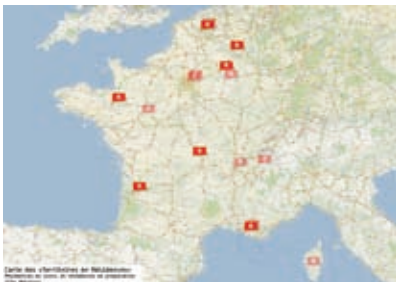
15 résidences programmées en 2009 et 2010.

« La lycée Haute qualité humaine » (avec la Région Champagne-Ardenne).