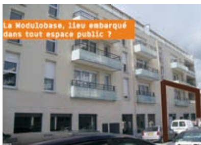
6 scénarios prospectifs autour des Cyberbases pour la Caisse des Dépôts.