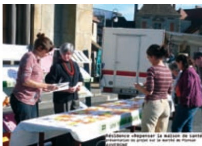
Résidence « Repenser la maison de santé », Région Auvergne.