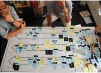
Redesigner le processus de décision régional.